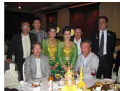
パタヤの美女を囲んで