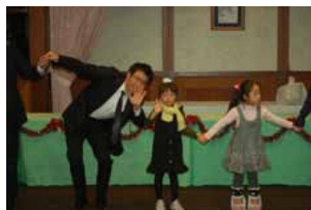
仲良く「また会う日まで」