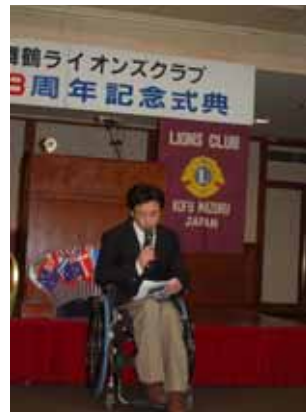
「ふれあい車椅子の会」 若狭代表より、事業報告