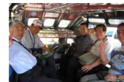
観光へ出発！ バスの乗り心地は...