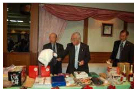
ビンゴゲームでは、新入会員の皆さんが大活躍！