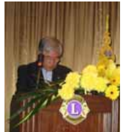
晩餐会の司会は東福寺L

東洋東南アジアフォーラム (2009年11月19日～22日 タイ パタヤ)が無事に終わり、 今は第93回シドニー国際大会 に向けて参加案内等の準備に 追われています。