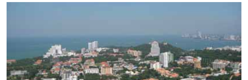
展望台よりパタヤ市内を眺めて

大会参加委員会はこれまで7回開催されています。今はシド ニー国際大会についての旅行日程・金額等さまざまな事項 を検討すべく、月に2回は横浜のキャビネット事務所、東京の複 合事務所へと飛び回っております。現在順調に準備が進んでお りますので、OSEAL フォーラムに負けない多数のメンバーの皆 様の参加をお願いします！参加することにより、他のクラブの行 動力、実行力等を間近で見て、知ることができます。甲府舞鶴ラ イオンズクラブの活性化のために、シドニーインターコンチネン タルホテルで、10名以上のメンバーで臨時例会をしましょう！！