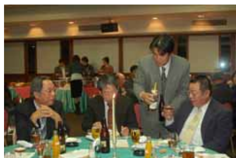
サドヤのスパークリングワインで乾杯！