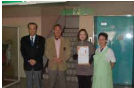
社会福祉法人 和久園へ