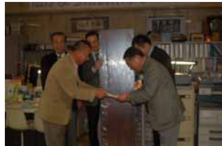
山梨県ボランティア協会へ