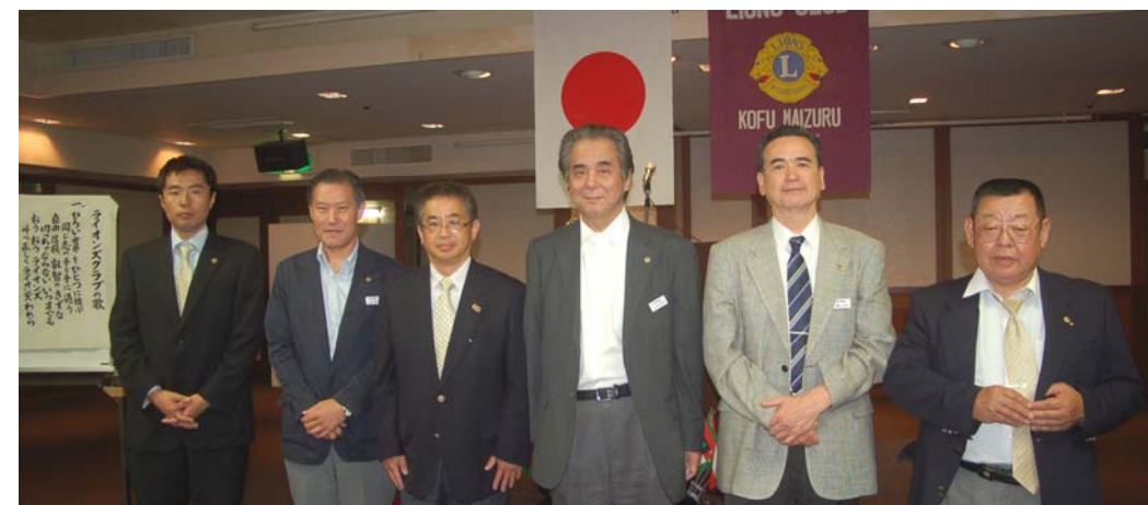
6月22日 ライオンナイト 新旧三役揃って