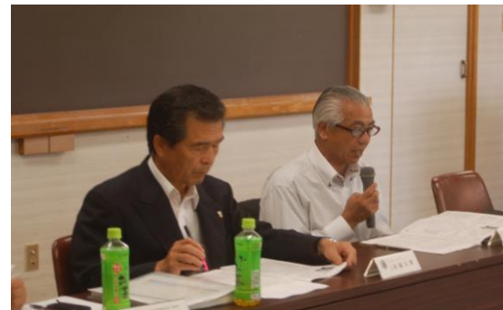
【8月7日 第1回ガバナー諮問委員会にて】