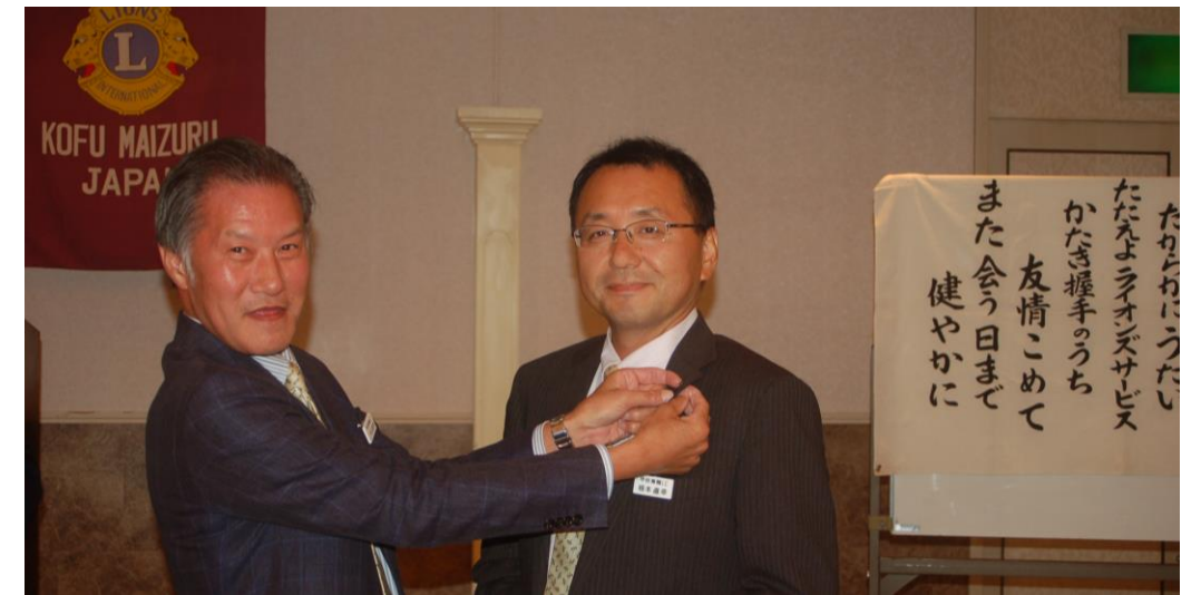
【ライオンナイトにて新旧会長のパッチ交換】