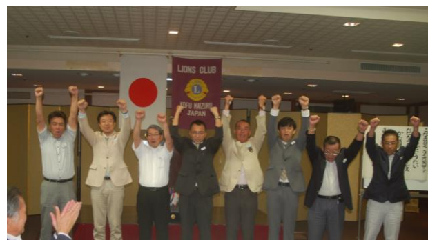
【初例会にて、会長と各委員会委員長の皆様】