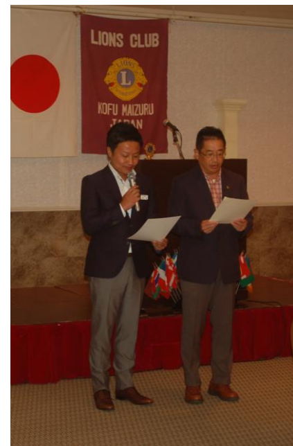
【丹沢会員委員長と共に「ライオンズの誓い」】